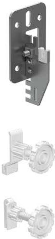
Abstandhalter auf Seite 56