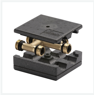
Raxofix-Kreuzungs-T-Stück für Heizungs-Installation mit SC-Contur Modell 5349 Artikel 647 964