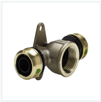
Raxofix-Wandscheiben-T-Stück mit SC-Contur Modell 5325.8 Artikel 647 698