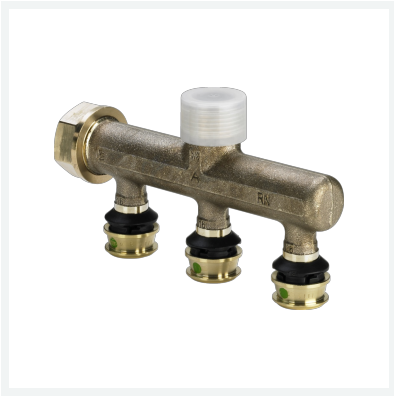
Raxofix-Verteiler mit SC-Contur Modell 5326.07 Artikel 645 601