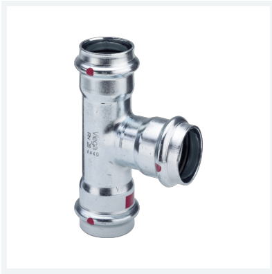
Prestabo-T-Stück mit SC-Contur Modell 1118 Artikel 605 193