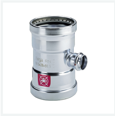
Prestabo XL-T-Stück mit SC-Contur Modell 1118XL Artikel 597 863