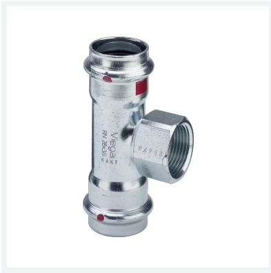
Prestabo-T-Stück mit SC-Contur Modell 1117.2 Artikel 558 901