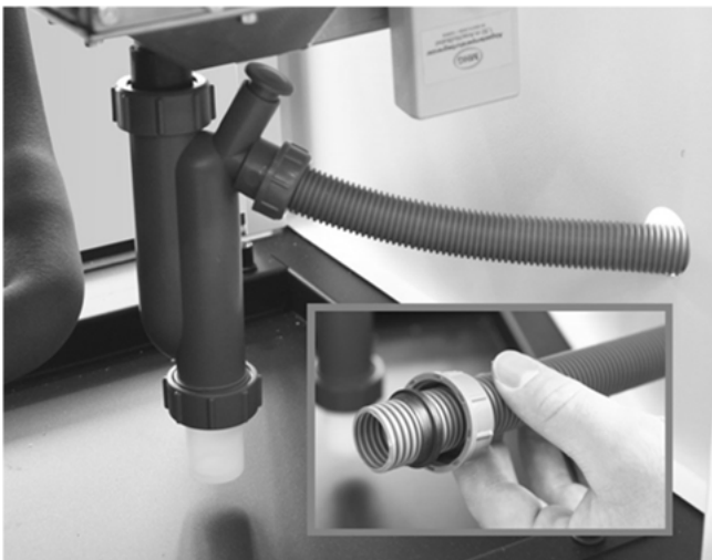
Abb. 3: Montage des Kondensatschlauchs