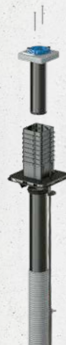
Quadro-Sicura® Nova R1