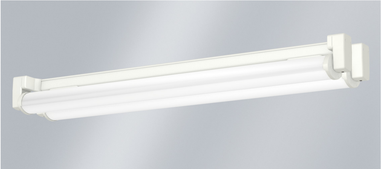
Abb. ggf. abweichend