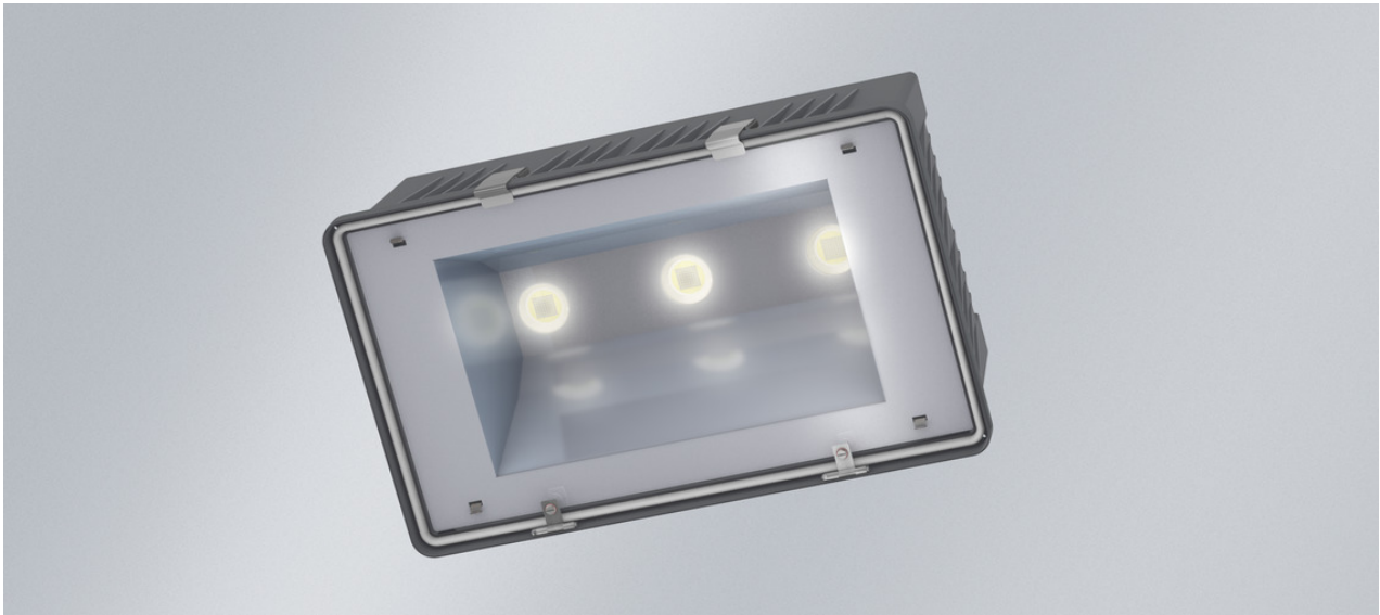
Abb. ggf. abweichend