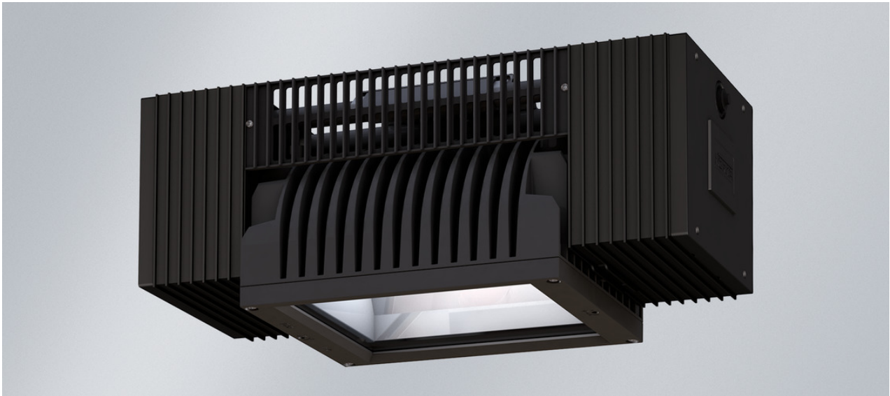
Abb. ggf. abweichend