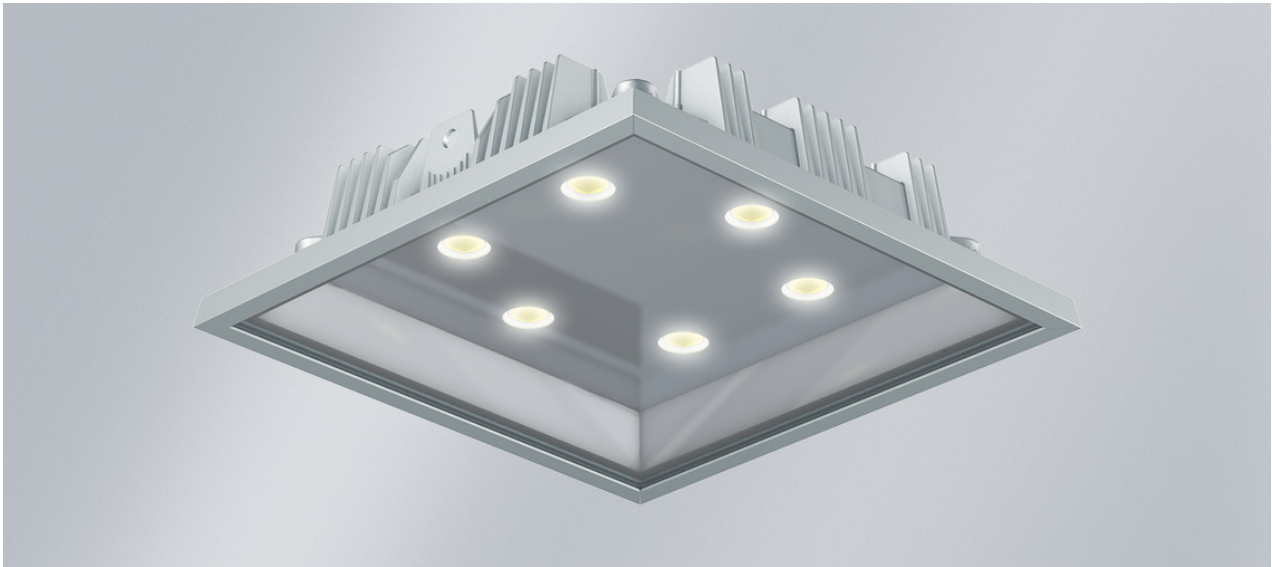
Abb. ggf. abweichend