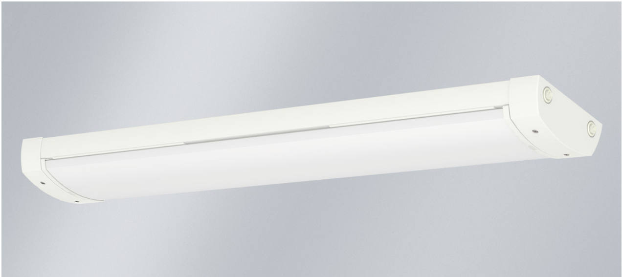
Abb. ggf. abweichend