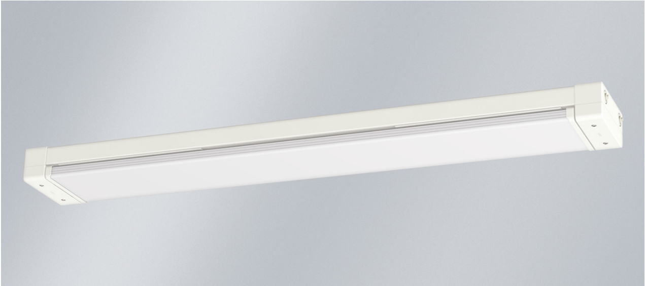
Abb. ggf. abweichend