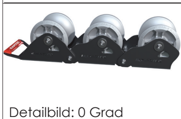
Detailbild: 0 Grad