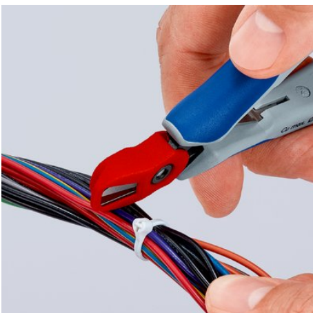
Einfach aufstecken: Der Abschnittfänger ist leicht angebracht und hält zuverlässig am Zangenkopf

Technische Änderungen und Irrtümer vorbehalten