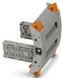
Blindstecker, Rastermaß: 8,2 mm, Länge: 81,5 mm, Breite: 73,4 mm, Polzahl: 6, Farbe: grau

Bitte beachten Sie, dass die hier angegebenen Daten dem Online-Katalog entnommen sind. Die vollständigen Informationen und Daten entnehmen Sie bitte der Anwenderdokumentation. Es gelten die Allgemeinen Nutzungsbedingungen für Internet-Downloads. ( http://phoenixcontact.de/download )