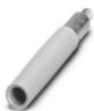
Prüfsteckerbuchse, Farbe: weiß

Prüfsteckerbuchse - PSBJ-URTK 6 WH - 3026448