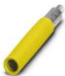
Prüfsteckerbuchse, Farbe: gelb

Prüfsteckerbuchse - PSBJ-URTK 6 YE - 3026405