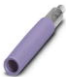
Prüfsteckerbuchse, Farbe: violett

Prüfsteckerbuchse - PSBJ-URTK 6 VT - 3026421