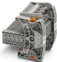
Teststecker, Polzahl: 7, Anschlussart: Schraubanschluss, Farbe: grau

Bitte beachten Sie, dass die hier angegebenen Daten dem Online-Katalog entnommen sind. Die vollständigen Informationen und Daten entnehmen Sie bitte der Anwenderdokumentation. Es gelten die Allgemeinen Nutzungsbedingungen für Internet-Downloads. ( http://phoenixcontact.de/download )