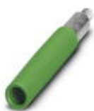
Prüfsteckerbuchse, Farbe: grün

Prüfsteckerbuchse - PSBJ-URTK 6 GN - 3026418