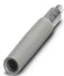
Prüfsteckerbuchse, Farbe: grau

Prüfsteckerbuchse - PSBJ-URTK 6 GY - 3026612