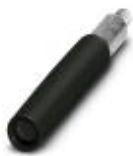
Prüfsteckerbuchse, Farbe: schwarz

Prüfsteckerbuchse - PSBJ-URTK 6 BK - 3026447