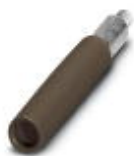
Prüfsteckerbuchse, Farbe: braun

Prüfsteckerbuchse - PSBJ-URTK 6 BN - 3026971