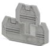
Abschlussdeckel, Länge: 69,9 mm, Breite: 2,2 mm, Höhe: 57,5 mm, Farbe: grau

Abschlussdeckel - D-UTTB 2,5/4 - 3047293