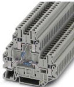
Bauelementreihenklemme, Anschlussart: Schraubanschluss, Querschnitt: 0,14 mm 2 - 4 mm 2 , AWG: 26 - 12, Breite: 5,2 mm, Farbe: grau, Montageart: NS 35/7,5, NS 35/15

Bitte beachten Sie, dass die hier angegebenen Daten dem Online-Katalog entnommen sind. Die vollständigen Informationen und Daten entnehmen Sie bitte der Anwenderdokumentation. Es gelten die Allgemeinen Nutzungsbedingungen für Internet-Downloads. ( http://phoenixcontact.de/download )