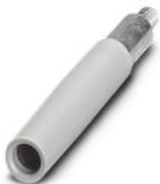
Prüfsteckerbuchse, Farbe: weiß

Bitte beachten Sie, dass die hier angegebenen Daten dem Online-Katalog entnommen sind. Die vollständigen Informationen und Daten entnehmen Sie bitte der Anwenderdokumentation. Es gelten die Allgemeinen Nutzungsbedingungen für Internet-Downloads. ( http://phoenixcontact.de/download )