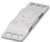
Universal-Wandadapter zur festen Montage der Stromversorgung bei starken Vibrationen. Die Stromversorgung wird direkt auf die Montagefläche geschraubt. Die Befestigung des Universal-Wandadapters erfolgt oben / unten.

Montageadapter - QUINT-PS-ADAPTERS7/1 - 2938196