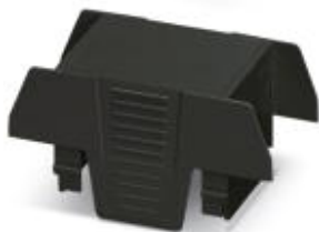
Einbaugeschäse, beidseitige Anschlussöffnung, Farbe: schwarz, Breite: 35 mm

Bitte beachten Sie, dass die hier angegebenen Daten dem Online-Katalog entnommen sind. Die vollständigen Informationen und Daten entnehmen Sie bitte der Anwenderdokumentation. Es gelten die Allgemeinen Nutzungsbedingungen für Internet-Downloads. ( http://phoenixcontact.de/download )