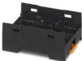
Einbaugeschäft, Farbe: schwarz, Breite: 52,5 mm

Bitte beachten Sie, dass die hier angegebenen Daten dem Online-Katalog entnommen sind. Die vollständigen Informationen und Daten entnehmen Sie bitte der Anwenderdokumentation. Es gelten die Allgemeinen Nutzungsbedingungen für Internet-Downloads. ( http://phoenixcontact.de/download )