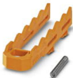
Einbaugehäuse, Länge: 55 mm, Lock-and-Release-System, Farbe: orange, Breite: 16,2 mm

Bitte beachten Sie, dass die hier angegebenen Daten dem Online-Katalog entnommen sind. Die vollständigen Informationen und Daten entnehmen Sie bitte der Anwenderdokumentation. Es gelten die Allgemeinen Nutzungsbedingungen für Internet-Downloads. ( http://phoenixcontact.de/download )