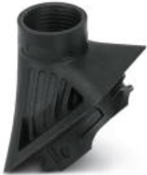
Adapter, Kunststoff, für EVO-Gehäuse, Pg16-Gewinde

Bitte beachten Sie, dass die hier angegebenen Daten dem Online-Katalog entnommen sind. Die vollständigen Informationen und Daten entnehmen Sie bitte der Anwenderdokumentation. Es gelten die Allgemeinen Nutzungsbedingungen für Internet-Downloads. ( http://phoenixcontact.de/download )