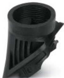
Adapter, Kunststoff, für EVO-Gehäuse, M32-Gewinde

Bitte beachten Sie, dass die hier angegebenen Daten dem Online-Katalog entnommen sind. Die vollständigen Informationen und Daten entnehmen Sie bitte der Anwenderdokumentation. Es gelten die Allgemeinen Nutzungsbedingungen für Internet-Downloads. ( http://phoenixcontact.de/download )