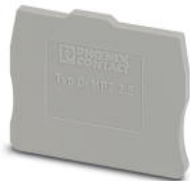
Abschlussdeckel, Länge: 36 mm, Breite: 2,2 mm, Höhe: 27,1 mm, Farbe: grau

Bitte beachten Sie, dass die hier angegebenen Daten dem Online-Katalog entnommen sind. Die vollständigen Informationen und Daten entnehmen Sie bitte der Anwenderdokumentation. Es gelten die Allgemeinen Nutzungsbedingungen für Internet-Downloads. ( http://phoenixcontact.de/download )