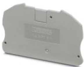
Abschlussdeckel, Länge: 75,4 mm, Breite: 2,2 mm, Höhe: 45,6 mm, Farbe: grau

Bitte beachten Sie, dass die hier angegebenen Daten dem Online-Katalog entnommen sind. Die vollständigen Informationen und Daten entnehmen Sie bitte der Anwenderdokumentation. Es gelten die Allgemeinen Nutzungsbedingungen für Internet-Downloads. ( http://phoenixcontact.de/download )