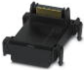
Axioline F-Bussockelmodul für Gehäusotyp BK

Busanschlussstecker - AXL BS BK - 2701422