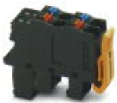
Axioline F-Einspeisestecker kurz (für z. B. AXL F BK ...)