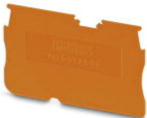
Abschlussdeckel, Länge: 48,6 mm, Breite: 0,8 mm, Höhe: 29 mm, Farbe: orange

Bitte beachten Sie, dass die hier angegebenen Daten dem Online-Katalog entnommen sind. Die vollständigen Informationen und Daten entnehmen Sie bitte der Anwenderdokumentation. Es gelten die Allgemeinen Nutzungsbedingungen für Internet-Downloads. ( http://phoenixcontact.de/download )