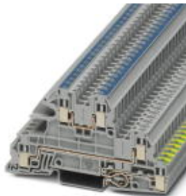
Installationsschutzleiterklemme, Schraubanschluss, Querschnitt: 0,2 mm 2 - 4 mm 2 , AWG: 24 - 12, Breite: 5,2 mm, Farbe: grau, Montageart: NS 35/7,5, NS 35/15

Bitte beachten Sie, dass die hier angegebenen Daten dem Online-Katalog entnommen sind. Die vollständigen Informationen und Daten entnehmen Sie bitte der Anwenderdokumentation. Es gelten die Allgemeinen Nutzungsbedingungen für Internet-Downloads. ( http://phoenixcontact.de/download )