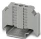
Endhalter, Breite: 9,5 mm, Farbe: grau