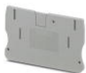
Abschlussdeckel, Länge: 67,7 mm, Breite: 2,2 mm, Höhe: 42,6 mm, Farbe: grau