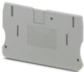
Abschlussdeckel, Länge: 67,7 mm, Breite: 2,2 mm, Höhe: 42,6 mm, Farbe: grau

Bitte beachten Sie, dass die hier angegebenen Daten dem Online-Katalog entnommen sind. Die vollständigen Informationen und Daten entnehmen Sie bitte der Anwenderdokumentation. Es gelten die Allgemeinen Nutzungsbedingungen für Internet-Downloads. ( http://phoenixcontact.de/download )