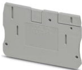
Abschlussdeckel, Länge: 57,7 mm, Breite: 2,2 mm, Höhe: 42 mm, Farbe: grau

Bitte beachten Sie, dass die hier angegebenen Daten dem Online-Katalog entnommen sind. Die vollständigen Informationen und Daten entnehmen Sie bitte der Anwenderdokumentation. Es gelten die Allgemeinen Nutzungsbedingungen für Internet-Downloads. ( http://phoenixcontact.de/download )