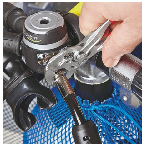
der Mini-Zangenschlüssel für feinmechanische Arbeiten