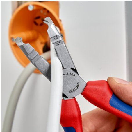
Schneiden von Kabeln bis \varnothing 13 mm