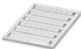
Abbildung zeigt die unbeschriftete Variante

Marker für Klemmen, bestellbar: mattenweise, weiß, beschriftet nach Kundenangaben, Montageart: verrasten in hoher Schildchennut, für Klemmenbreite: 8,2 mm, Schriftfeldgröße: 7,6 x 10,5 mm