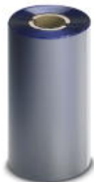
Farbband, Breite: 110 mm, Farbe: blau

Bitte beachten Sie, dass die hier angegebenen Daten dem Online-Katalog entnommen sind. Die vollständigen Informationen und Daten entnehmen Sie bitte der Anwenderdokumentation. Es gelten die Allgemeinen Nutzungsbedingungen für Internet-Downloads. ( http://phoenixcontact.de/download )