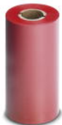
Farbband, Breite: 110 mm, Farbe: rot

Bitte beachten Sie, dass die hier angegebenen Daten dem Online-Katalog entnommen sind. Die vollständigen Informationen und Daten entnehmen Sie bitte der Anwenderdokumentation. Es gelten die Allgemeinen Nutzungsbedingungen für Internet-Downloads. ( http://phoenixcontact.de/download )