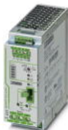
Unterbrechungsfreie Stromversorgung mit IQ Technology zur Tragschienenmontage, Eingang: 24 V DC, Ausgang: 24 V DC / 40 A, inkl. montiertem Universaltragschienenadapter UTA 107/30

Bitte beachten Sie, dass die hier angegebenen Daten dem Online-Katalog entnommen sind. Die vollständigen Informationen und Daten entnehmen Sie bitte der Anwenderdokumentation. Es gelten die Allgemeinen Nutzungsbedingungen für Internet-Downloads. ( http://phoenixcontact.de/download )