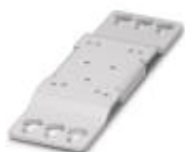
Universal-Wandadapter zur festen Montage der Stromversorgung bei starken Vibrationen. Die Stromversorgung wird direkt auf die Montagefläche geschraubt. Die Befestigung des Universal-Wandadapters erfolgt oben / unten.