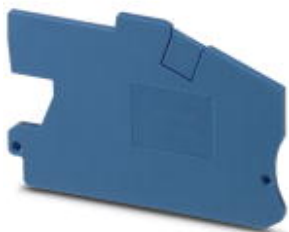
Abschlussdeckel, Länge: 66 mm, Breite: 2,2 mm, Höhe: 42,3 mm, Farbe: blau

Bitte beachten Sie, dass die hier angegebenen Daten dem Online-Katalog entnommen sind. Die vollständigen Informationen und Daten entnehmen Sie bitte der Anwenderdokumentation. Es gelten die Allgemeinen Nutzungsbedingungen für Internet-Downloads. ( http://phoenixcontact.de/download )