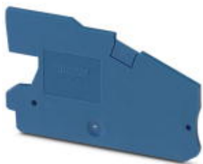
Abschlussdeckel, Länge: 66,2 mm, Breite: 2,2 mm, Höhe: 38,6 mm, Farbe: blau

Bitte beachten Sie, dass die hier angegebenen Daten dem Online-Katalog entnommen sind. Die vollständigen Informationen und Daten entnehmen Sie bitte der Anwenderdokumentation. Es gelten die Allgemeinen Nutzungsbedingungen für Internet-Downloads. ( http://phoenixcontact.de/download )