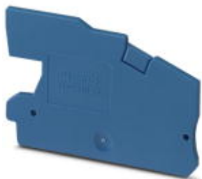
Abschlussdeckel, Länge: 59,7 mm, Breite: 2,2 mm, Höhe: 38,6 mm, Farbe: blau

Bitte beachten Sie, dass die hier angegebenen Daten dem Online-Katalog entnommen sind. Die vollständigen Informationen und Daten entnehmen Sie bitte der Anwenderdokumentation. Es gelten die Allgemeinen Nutzungsbedingungen für Internet-Downloads. ( http://phoenixcontact.de/download )