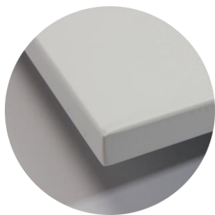
Detail von der Ecke