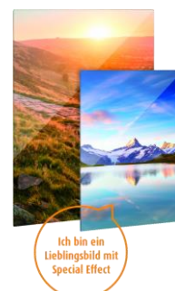
Bedruckt als VL-AxxxxxB