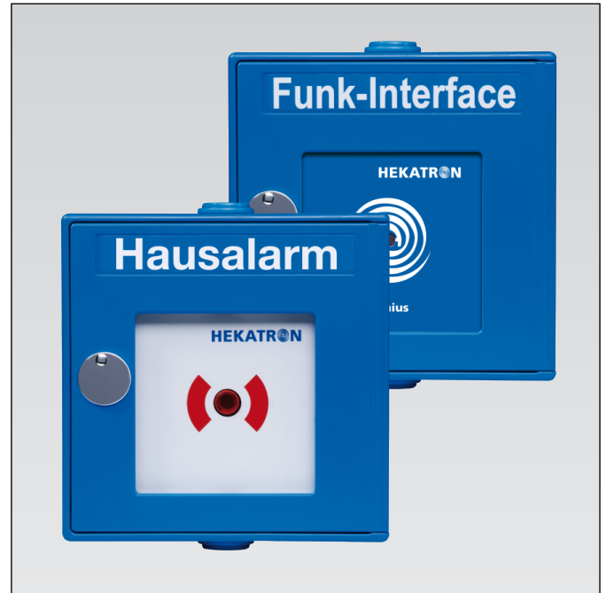
Abb. 01: Manueller Hausalarm und Funk-Interface in einem Gerät. Die mitgelieferten Aufkleber und Einleger können entsprechend der Anwendung gewählt und angebracht werden.