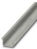
Tragschiene ungelocht, Standardprofil 2,3 mm, Breite: 35 mm, Höhe: 15 mm, nach EN 60715: 2001, Material: Stahl, verzinkt, dickschichtpassiviert, Länge: 2000 mm, Farbe: silberfarben

Tragschiene ungelocht - NS 35/15-2,3 UNPERF 2000MM - 1201798