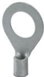
Ringkabelschuh, unisoliert, 10 mm 2 , M12

Bitte beachten Sie, dass die hier angegebenen Daten dem Online-Katalog entnommen sind. Die vollständigen Informationen und Daten entnehmen Sie bitte der Anwenderdokumentation. Es gelten die Allgemeinen Nutzungsbedingungen für Internet-Downloads. ( http://phoenixcontact.de/download )